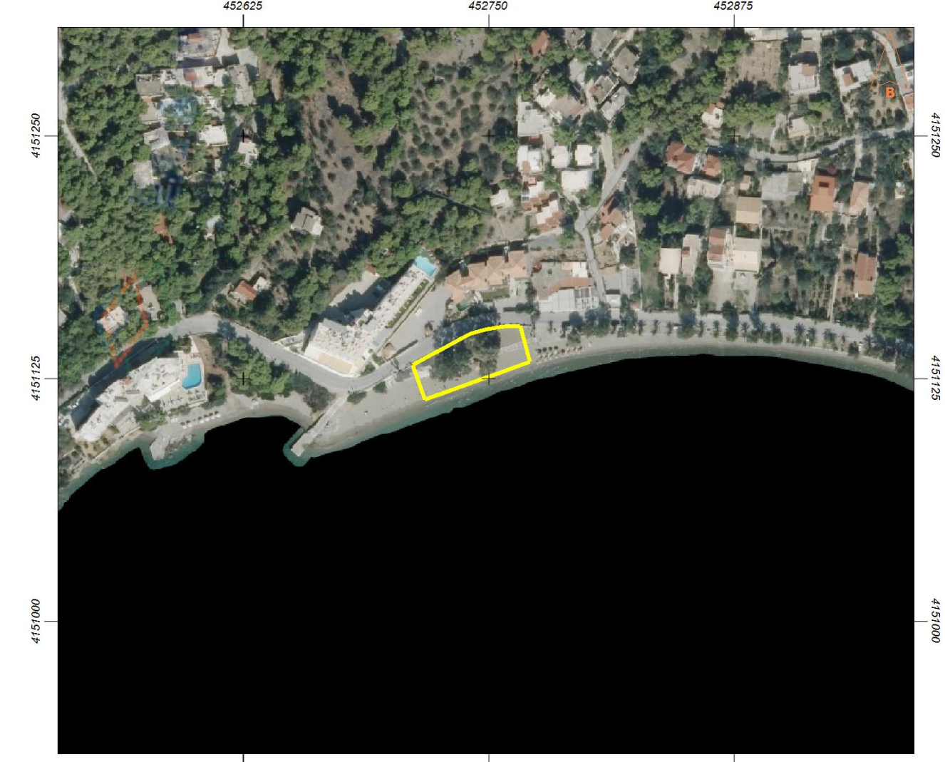
ΑΠΟΣΠΑΣΜΑ ΟΡΘΟΦΩΤΟΓΡΑΦΙΑΣ ΤΗΣ ΕΚΧΑ Α.Ε.